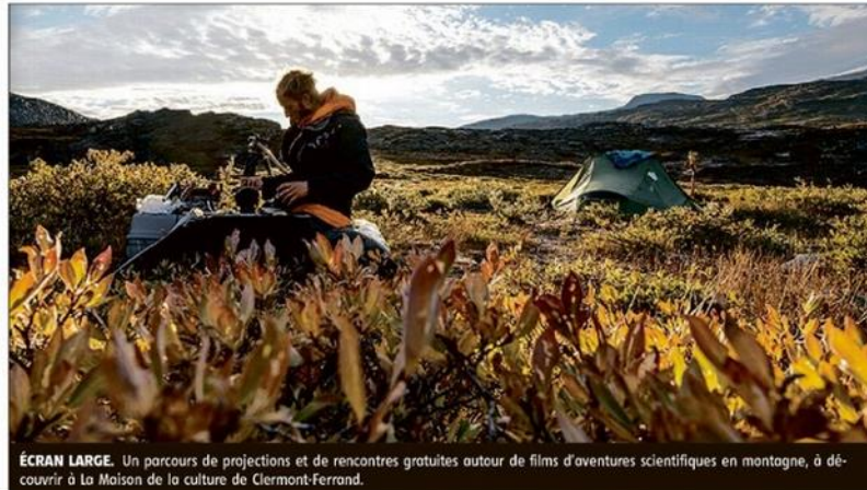
ÉCRAN LARGE. Un parcours de projections et de rencontres gratuites autour de films d'aventures scientifiques en montagne, à découvrir à La Maison de la culture de Clermont-Ferrand.

Après ce succès, le festival revient à Clermont cette année. Le 12 janvier, la salle Boris-Vian de la Maison de la culture accueillera à nouveau scientifiques et réalisateurs pour échanger avec le public sur leur travail de re-